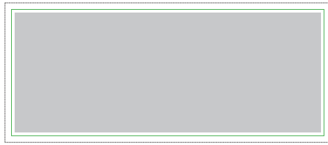
1:1 Vorlage auf Seite 2

Gesamte Grafikfläche (mit Beschnitt): 1980 x 850 mm